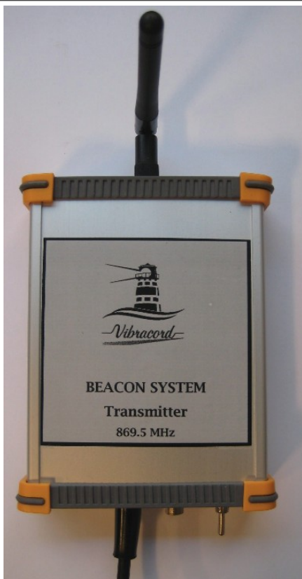
Unidad estándar, módulo transmisor